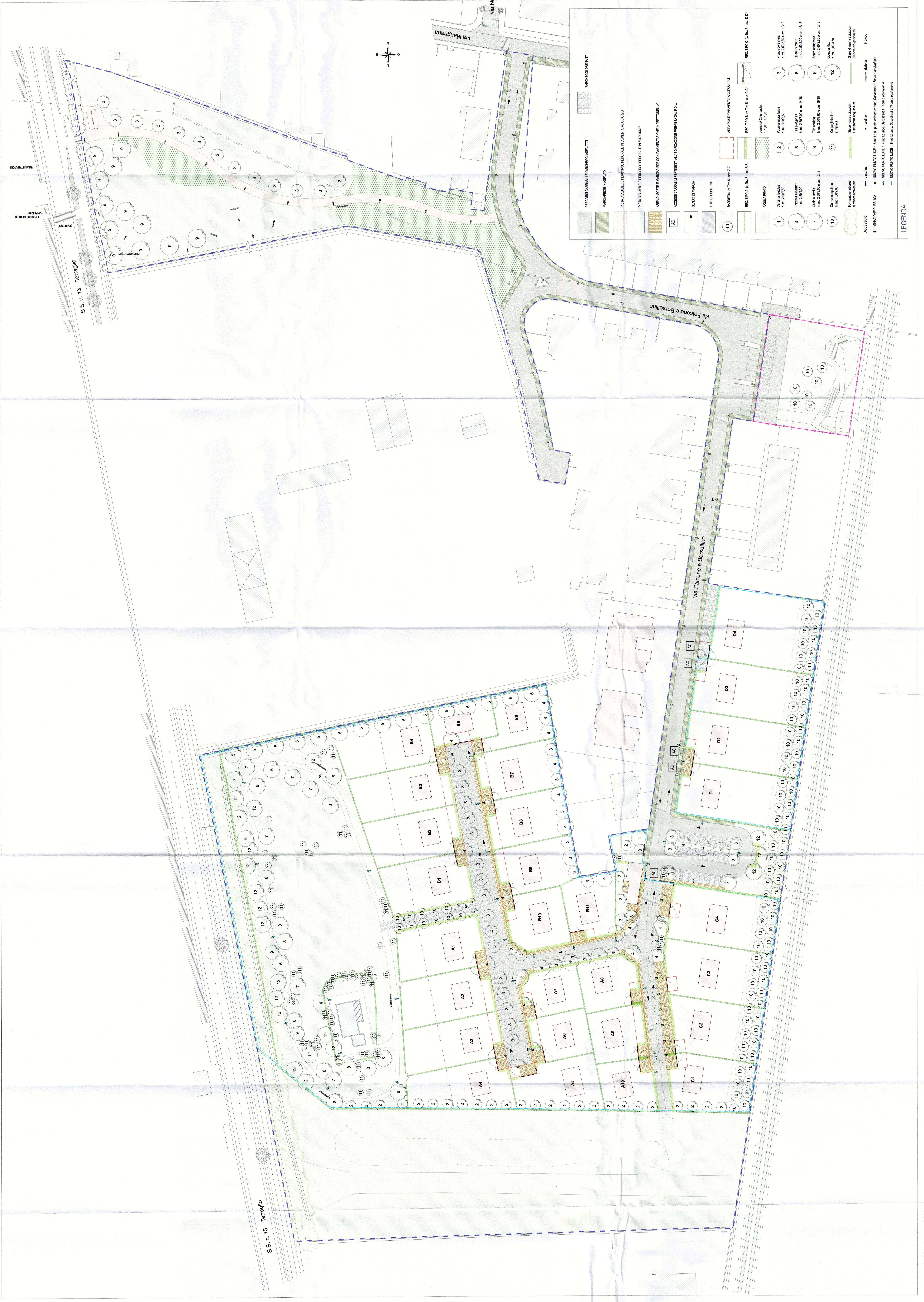
Planimetria GENERALE - scala 1:500