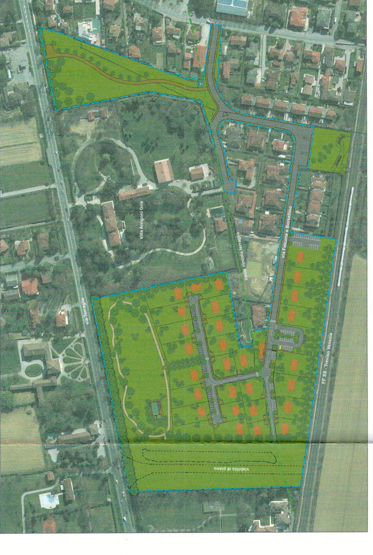
FOTOPIANO CON INSERIMENTO PROGETTO P.d.L. (la rappresentazione all'interno dei lotti sono schematizzate)